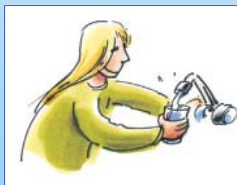
Toujours disponible à domicile