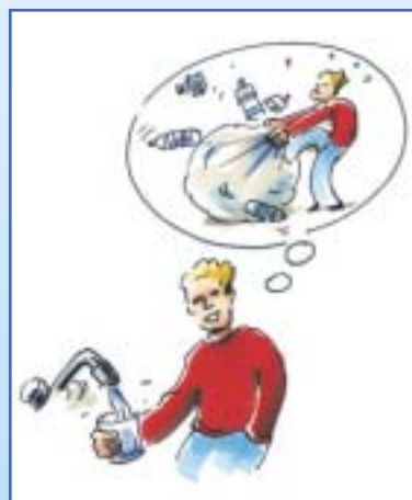
Sans production de déchets d'emballage