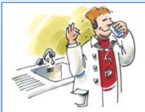
Potable et de qualité