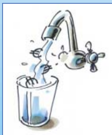
Très économique à l'achat